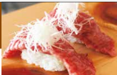
能登牛の炙りにぎり 700円(税込)～

4ランク以上の厳選された能登牛を使用。丁寧に手刺してその場で焼き上げてくれます。炙り寿司は石川県産コシヒカリを使用し、表面を丁寧に炙ります。