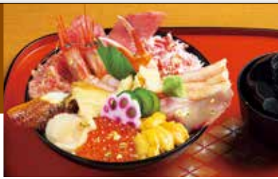
一番人気の特選海鮮丼 3,200円(税込)

厳選素材をあふれんばかりに盛り込んだ海鮮丼が人気です。味はもちろん、見た目も豪華絢爛で近江町市場の専門店の中でも屈指の人気店です。