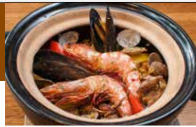
市場のごちまぜ海鮮バエリア 2,760円/2人前(税別)

石川産の美味しいお米と金沢自慢の魚介をスペイン風に。伊賀焼の土鍋で炊き上げるバエリアは必ず食べてほしい一品です。2件目使いにもおすすめ。