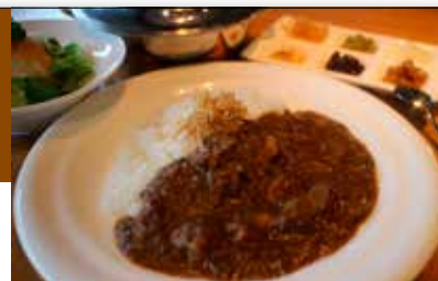
開業より人気の「評判のビーフカレー」

四季折々のメニューが揃い、ランチフェアなどイベントも随時開催。パティシエ特製ケーキもおすすめです。特典は館内レストランでも使えるので要チェック。