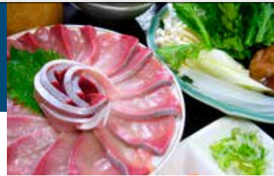
脂の乗った甘味 鯛しゃぶコース(梅) 6,480円(税込)～

能登半島6市町で毎年7月～9月まで行われる「能登キリコ祭り」。そんな雰囲気漂う店内は個室も色々あるのでゆったりくつろげる造りになっています。