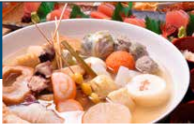
秘伝のだしがしみた自家製おでん100円(税込)～

金澤おでんの老舗で代表店。熟練の技と火の調理で作り上げる澄みきった秘伝のだしがしみ込んだ自家製おでんは、地元で愛され続けてきた味です。