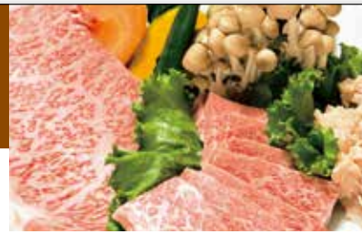
能登牛モモ980円、特選ハラミ1,380円がおすすめ

焼肉を日本に広めた人物に師事した先代が、昭和45年に創業した金沢屈指の名店。能登牛をはじめ、上質なお肉の味を最大限に引き出す秘伝のタレに魅了されます。