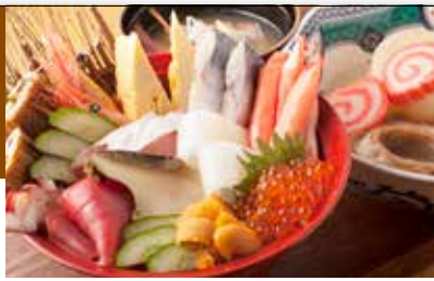
海鮮丼・寿司・おでん・能登牛、石川県の魅力が満載！

近江町市場直送の海鮮や、県のブランド牛である能登牛など、石川の魅力が詰まった丼ぶりを朝8時から楽しめます。団体席もあり、大人数での利用にも。